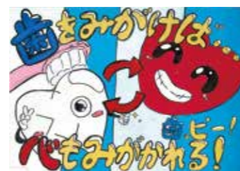
令和7年度 最優秀作品 立川市立第八小学校 6年 獨古にい榔